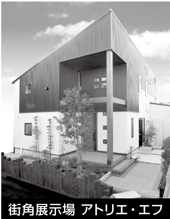
街角展示場 アトリエ・エフ

平成23年4月19日ホテルニューオータニにて当社の街角展示場「アトリエ・エフ」が一般財団法人グリーンジャパン主催の第3回日本ハウスオブザイヤーにおいて前回のグランプリに続き、堂々第3位を受賞いたしました。 この賞は豊かさを実感できる「住まい」とはどのようなものなのか?をテーマに木造住宅において日本全国の応募の中から厳選されて今回の受賞となりました。審査基準としては、①「豊かさ」を感じさせる家 ②次世代に継承できる価値のある家 ③千年持続デザインとしてのヒントにあふれているものです。具体的には健康で豊かな暮らしを実現させる工夫のあるプランや提案、「長寿命住宅」を考えた材料や構造や仕様、地球環境、地域環境を考えた材料や構造や仕様、地域の風土や街並みなどを考えたデザイン(外観・外構)などです。 今回応募作品の「アトリエ・エフ」は当社の高性能住宅「ユトリロ365」がベースになっていて、実質ゼロエネルギー住宅を目標に造られています。性能もQ値11.76W/m 2 ・Kを実現しました。また、屋根には5.8KWの太陽光発電パネルを搭載し、最近話題の地中熱を利用した弊社の独自の技術でもあるジオサーマルシステムを採用しています。地中熱は一年通じて16℃と安定していることに注目しました。 地盤改良用の鋼管杭を利用して放熱銅管を地中に通し給湯、冷暖房システムで使用電力を大幅に削減しています。 また、全ての構造材、内・外装材に国産材を使用しました。当社は岩手県葛巻町森林組合と協力し、山林を所有。森林を育成する取り組みも行っています。