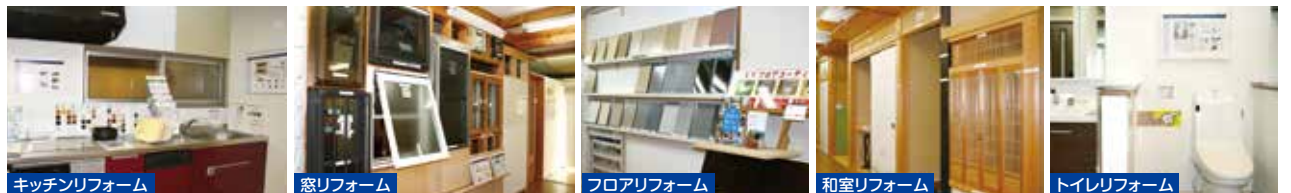
キッチンリフォーム