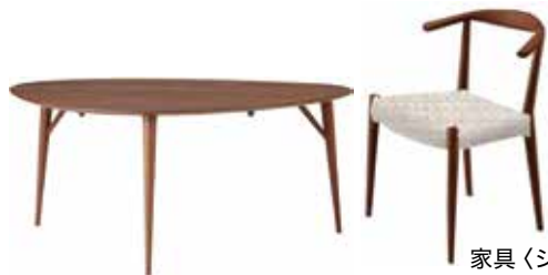
家具 (シックモダン)