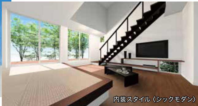
内装スタイル (シックモダン)