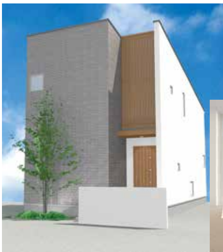
外観デザイン (アネモネ)