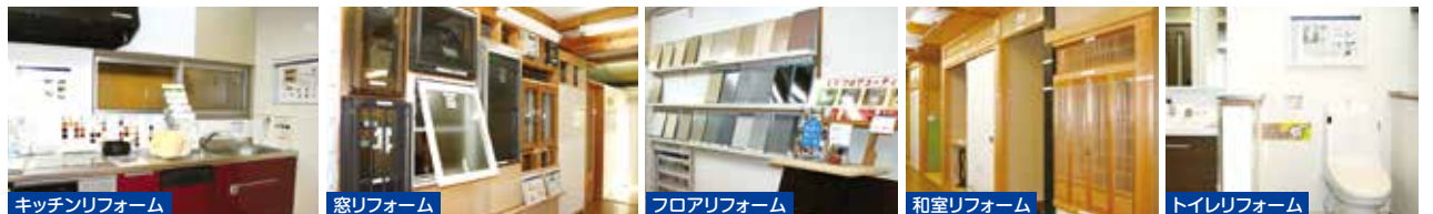
キッチンリフォーム