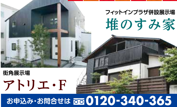
フィットインプラザ併設展示場 堆のすみ家