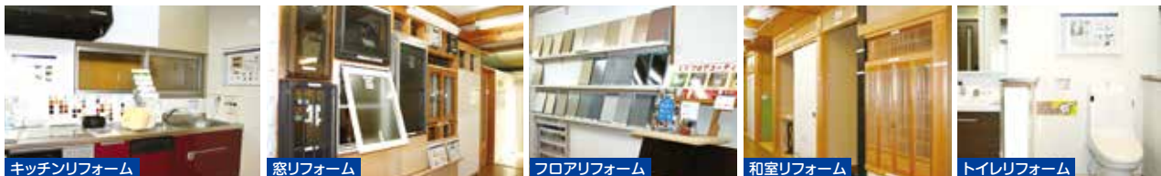
キッチンリフォーム