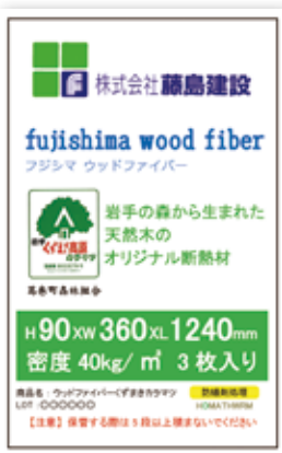
▶フジシマウッドファイバー商品シール