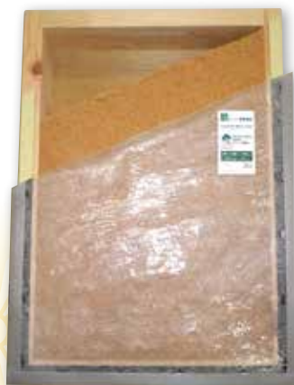
▶フジシマウッドファイバー