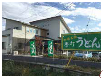
藤島建設施工 平成29年4月竣工

OBのT様ご家族が経営する「こぶし」をご紹介します。 お父様の手打ちそば、二代目の手打ちうどんが絶品です。