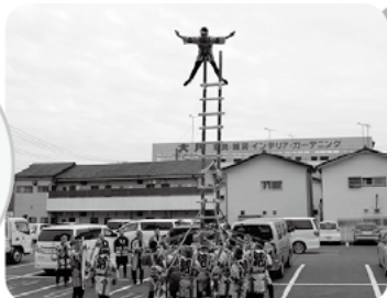
写真は昨年開催の様子です