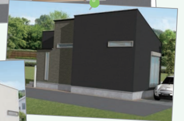
デザイナーの設計による 上質な外観テイスト